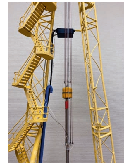
РИС. 2. Расположение лазерного измерителя на экспериментальном стенде

Общими для перечисленных способов недостатками являются: • остановка процесса бурения, что влечет экономические потери предприятия, простой скважины; • ошибки измерения длины кабеля (каната) при спуске длинномерных тел, соединяемых в колонну, связанные с непрерывностью процесса подсчета числа оборотов мерных роликов и невозможностью исключения из процесса измерения обязательных возвратно-поступательных движений насосно-компрессорных труб (НКТ) при формировании трубной колонны;